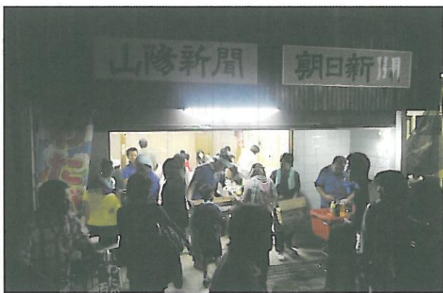
赤米カレーと総社ドッグを販売した夕やけ食堂栄町店