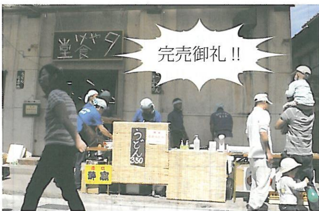
赤米うどんを販売した夕やけ食堂東田町店