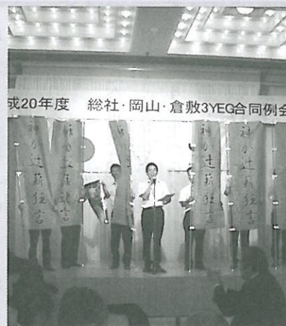
7月 岡山・倉敷・総社合同例会