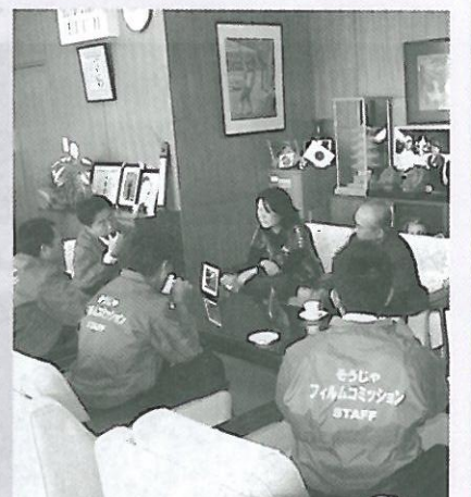
そうじゃフィルムコミッション