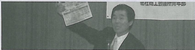
商人育成セミナー (7、6、9、12月)