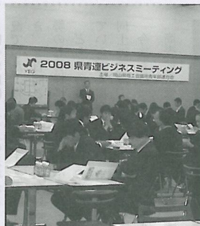
11月 県青連ビジネスミーティング