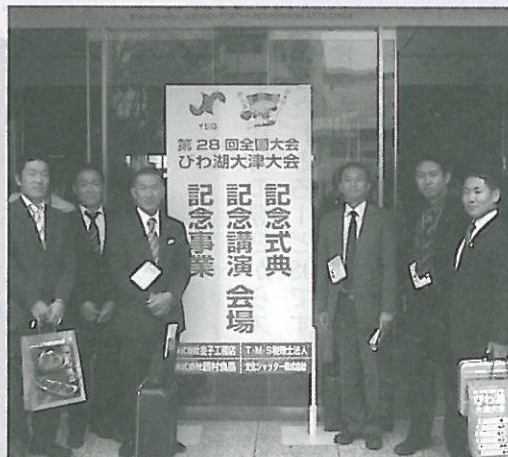
11月 全国大会 びわ湖大津大会